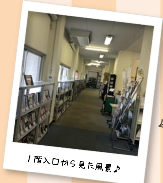
1階入口から見た風景♪