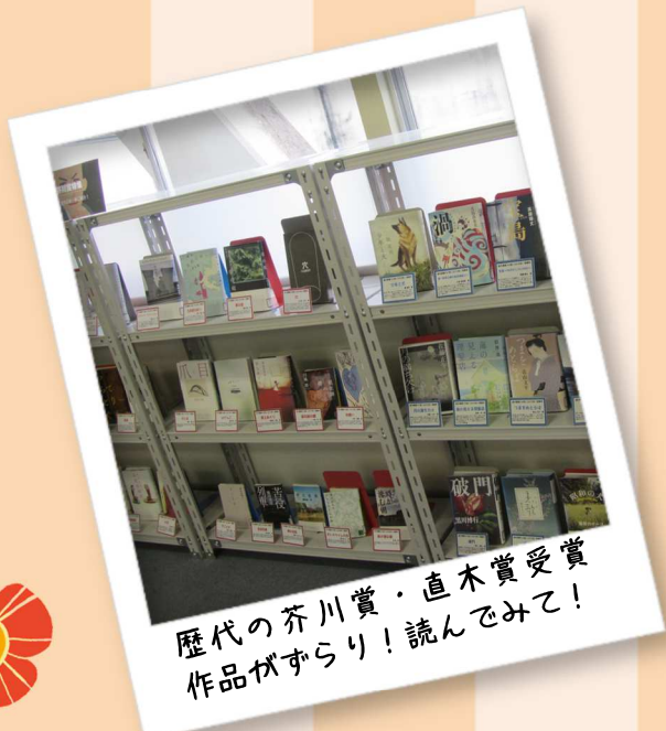
歴代の芥川賞・直木賞受賞 作品がずらり！読んでみて！

より使いやすい図書館、居心地のいい図書館を目指して、コロナ禍でも図書館は歩みを止めません！ 1階にあった参考図書を2階に移動し、1階には絵本を並べました。 また、レポートの書き方の本や、本屋大賞・芥川賞・直木賞を受賞した話題本、 専攻科生の修了研究論文集など、皆さんが手に取りたいような資料を取り揃えています。 雑誌・マンガコーナーも背の高い書架を撤去してよりつるげるスペースになりました。 是非、図書館に足を運んで体感してください。