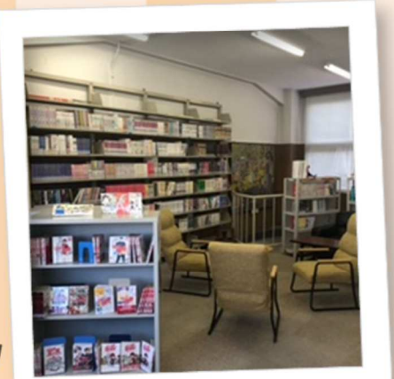
みんな大好き！ 雑誌・マンガコーナー♡