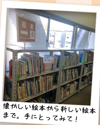
懐かしい絵本から新しい絵本 まで。手にとってみて！