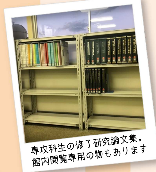
専攻科生の修了研究論文集。 館内閲覧専用の物もあります