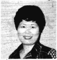
(高知県歯科衛生士会副会長)