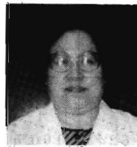
(高知県栄養士会 会長)

歯の衛生週間は、一年中で一番忙しく、世間様から注目される希節です。ともあれ、私達、歯科衛生士にとって、毎日がムシ歯予防デー、歯周病予防デーなのです。歯科保健向上のために、頑張りましょう。